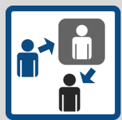
FONTI DEI DATI

I dati personali in nostro possesso vengono raccolti attraverso la navigazione sul nostro sito, a prescindere dalla richiesta o meno di informazioni, preventivi, formulazione ordini, iscrizione alla newsletter.