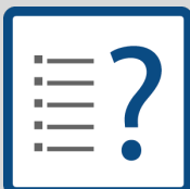
TIPOLOGIA DI DATI

Consideriamo inoltre legittimo interesse garantire la sicurezza del Sito e delle informazioni sullo stesso scambiate, ossia la capacità di tale Sito di resistere, a un dato livello di sicurezza, a eventi imprevisti o ad atti illeciti o dolosi che compromettano la disponibilità, l'autenticità, l'integrità e la riservatezza dei dati personali conservati o trasmessi e la sicurezza dei relativi servizi offerti o resi accessibili;